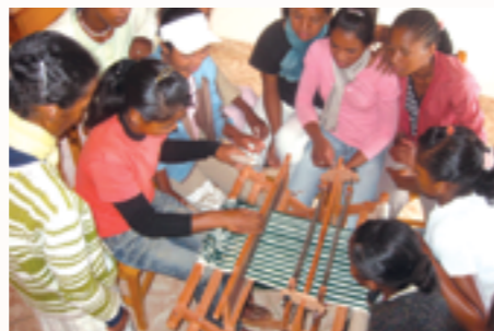
Cours de couture pour les jeunes filles formées au Foyer Oliva Ulrich d'Antsirabe