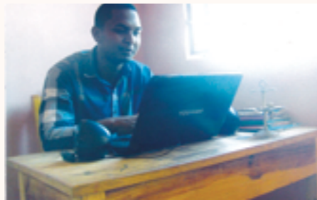
un instituteur travaillant avec le nouveau ordinateur