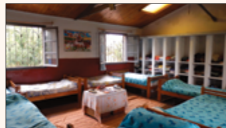
les élèves du Centre EDSR et les linges de maisons reçus