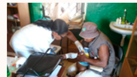
Dépistage de la drépanocytose

Depuis 2014, 4 640 enfants et adultes ont été déjà dépistés et 1 982 malades ont été pris en charge. Plus d'une trentaine de personnel de santé issue des formations sanitaires publiques et privées partenaires ont été formés sur le dépistage néonatal de la maladie