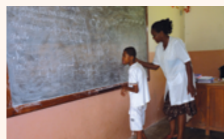
un des enfants en cours de mathématique

Le Consulat contribue annuellement depuis 2012 à la prise en charge des salaires des éducateurs du Centre.