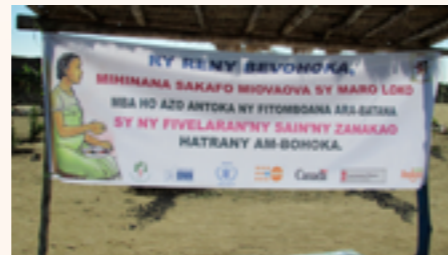
Banderole de sensibilisation à l'éducation nutritionnelle