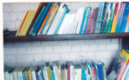
Nouvelle étagère garnie de livres de bibliothèque