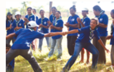
animation et journée récréative durant le camp

Le Consulat appuie depuis 8 ans les grands camps annuels organisés par l'association au bord de la mer. Les 70 jeunes handicapés et jeunes valides, membres de l'association, ont pu ainsi passer dix jours à Mananjary, sur la côte sud-est de l'île.