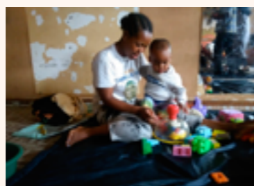
quelques matériels d'éveil acquis

Ces ateliers mère-enfants ciblent les femmes enceintes et les mères ayant des enfants de 0 à 2 ans et ont pour objectif de sensibiliser les mamans aux besoins de leurs enfants par le biais d'un atelier d'échange, d'apprentissage de soins de l'enfant et de l'éducation. 500 enfants y sont inscrits et leurs mères sont accompagnées par 11 animateurs.