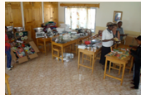
les matériels électroménagers et machines à coudre qui viennent d'arriver