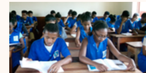
cours de français en classe de seconde

La Congrégation gère plusieurs écoles réparties dans toute l'île, notamment à Toamasina, Ambositra, Antsirabe, Morondava et Antananarivo ainsi qu'un orphelinat à Toamasina. Il lui a été remis en 2016 73 cartons contenant des livres et matériels scolaires destinés à améliorer la qualité de la scolarité des 5.500 élèves inscrits dans ses écoles.