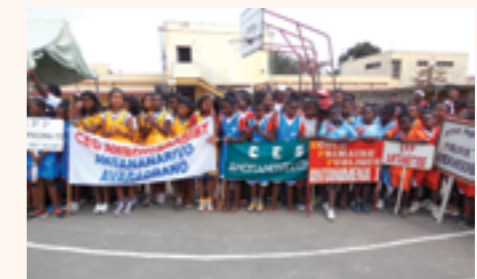
Remise officielle des équipements sportifs avec SEM le Ministre de l'Education Nationale