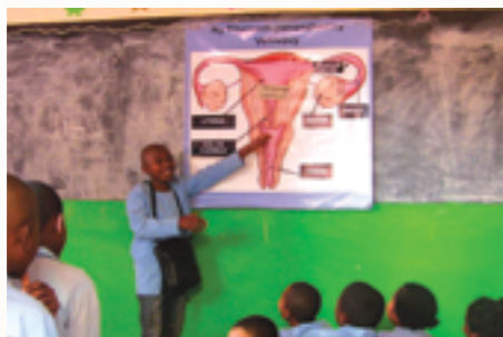
Séance sur la santé de la reproduction animé par un Jeune leader de l'association Lead santé dans un collège publique de la ville de Fianarantsoa

Les différentes activités menées par Lead Santé, Bel Avenir, le foyer Oliva Ulrich et le centre Fanantenana ont pour objectifs principaux d'améliorer la qualité et l'attractivité de l'enseignement des établissements publics et privés des zones d'interventions, de soutenir la scolarisation des enfants et jeunes issus des familles démunies pour prévenir l'abandon scolaire et d'améliorer les conditions nutritionnelles et d'accueil des jeunes pris en charge dans le cadre du projet.