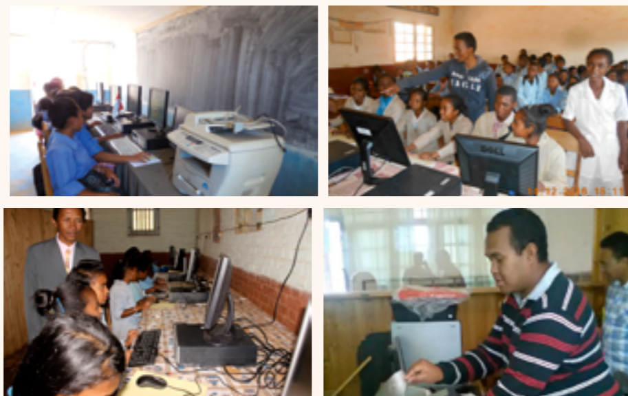
quelques établissements bénéficiaires