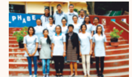
les 15 lycéens et la Directrice par intérim de St. Antoine