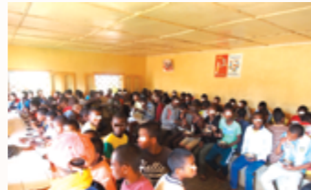
les jeunes détenus au moment des repas

« Grandir Dignement » est une association française intervenant à Madagascar depuis 2009 en faveur des mineurs en détention et intervient sur divers volets (médical, alimentaire, judiciaire, éducatif, scolaire et orientation post-carcérale), et ce dans l'objectif de contribuer au respect de la dignité de ces jeunes.