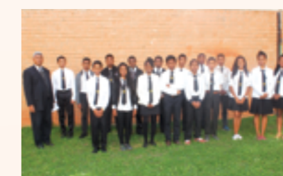
Collège St Michel : le Père Recteur et les adolescents pris en charge par le Consulat