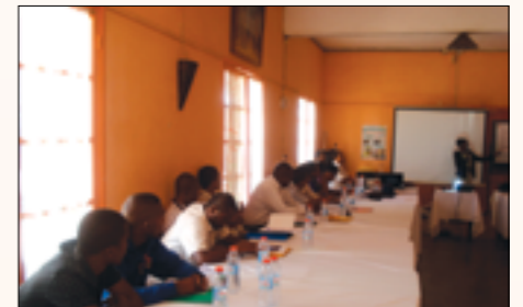
séance de formation pour les responsables des centres

Les sessions de formation de 2016 ont eu pour thème « Elaboration et appropriation de Code d'éthique professionnelle des centres d'accueil à Madagascar » et ont été prodiguées à l'ensemble des ressources humaines des centres. La formation a été avec l'appui technique du cabinet CMR (Changement pour de Meilleurs Résultats) de Yaoundé – Cameroun.