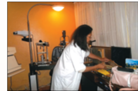
l'appareil ophtalmologie dans le cabinet d'un médecin

Service ophtalmologie et autres services de l'hôpital : 1 appareil ophtalmologie, des sets de pose, masques à oxygène, sets de soin