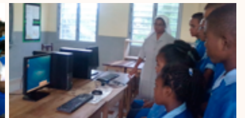
initiation à l'informatique