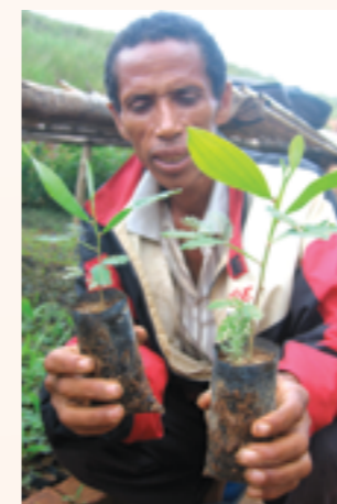
Un pépiniériste villageois formé par l'ONG Lalona, partenaire d'exécution du projet

L'objectif de ce projet porté par l'ONG Zébunet et mis en œuvre conjointement avec l'ONG malagasy Lalona est de lutter contre la pauvreté et d'améliorer les conditions de vie communautaire à Madagascar.