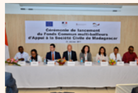
Signature de la déclaration commune pour la création d'un fonds commun multi bailleurs d'appui à la société civile malagasy

Cette initiative s'inscrit dans le cadre de la déclaration de Paris sur l'efficacité de l'aide et marque la volonté des parties prenantes d'œuvrer ensemble et d'insérer leurs actions dans le cadre du Programme National de Développement de Madagascar.