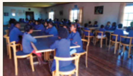
les tables et chaises très utiles pour les enfants de l'orphelinat Akany Solofo