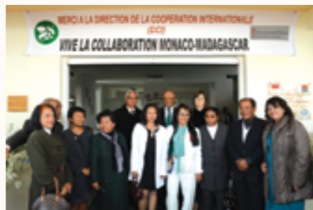
Inauguration du bâtiment des Orchidées Blanches le 1er juin 2016

L'année 2016 a été marquée par l'inauguration au mois de juin d'un bâtiment de deux étages dont les revenus issus de la location serviront à financer les frais de fonctionnement du centre médico-social les Orchidées Blanches.