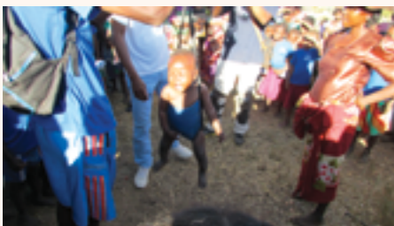
Pesée hebdomadaire des enfants du programme Miaro

Au mois de décembre, un nouvel avenant au contrat de partenariat et de financement a été signé avec les porteurs du projet pour permettre le développement de jardins communautaires.