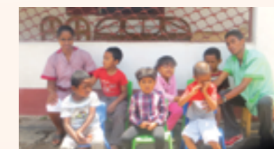
Quelques enfants du Centre

Une première contribution lui a été octroyée afin d'appuyer le fonctionnement du centre ; ce qui a permis d'assurer une partie des charges du personnel, du paiement du loyer et l'achat de gaz combustible.