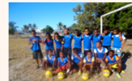
le club sportif avec les nouveaux maillots

Des matériels informatiques, vêtements et équipements sportifs ainsi que quelques outillages ont été fournis en 2016 pour équiper la bibliothèque et le club sportif de l'école.