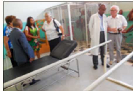
lors de la remise officielle des équipements de rééducation fonctionnelle

Service Rééducation fonctionnelle : 1 lit réglable, 2 lits de massage, 1 brancard, 1 vélo ergométrique, 1 appareil pour abdominaux, 1 appareil de posture, 1 appareil pour étirement, 2 plateaux de Freeman, des accessoires pour pouliothérapie (élingues, poulie..), des sacs de sable de différents poids