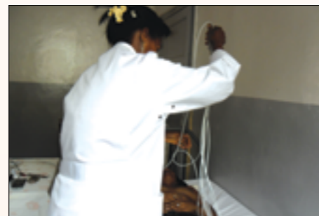
un des consommables médicaux en utilisation

Des potences, matelas à coquille avec accessoires, lampes infrarouge, blouses de médecin, seringues, perfuseurs, cathéters, sets de pansements, nébuliseurs et autres consommables médicaux