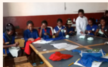
quelques jeunes en séance de couture avec les linges dotés

Il lui a été octroyé en 2016, 18 ordinateurs complets, 18 cartons de matériels scolaires et linges de maison, 10 tables et 30 chaises.