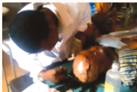
le matelas mobilisateur utilisé d'urgence sur une patiente accidentée

1 matelas mobilisateur anthropométrique, 1 bouteille d'oxygène, des potences, plateaux pour pansement, blouses de médecin, pipettes pasteur labo, bocaux pour laboratoire, masques, perfuseurs, seringues, masques d'oxygène, tuyaux d'oxygène, tuyaux d'aspiration, seringues de vaccination, robinets à 3 voies et divers consommables