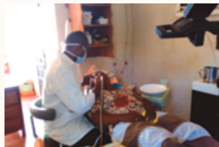
le dentiste avec le masque reçu du Consulat