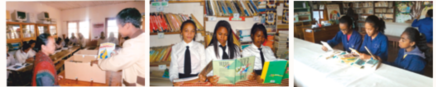
les élèves en lecture, à la bibliothèque