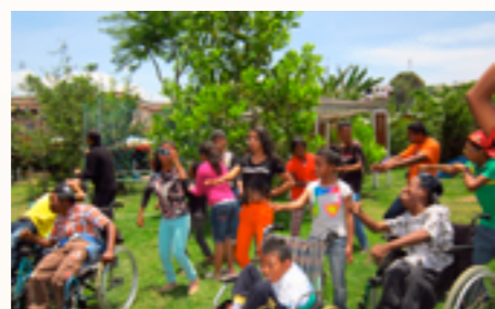
journée de détente pour les enfants

Depuis sa création en 2003 sur l'initiative d'une personne handicapée ; ce centre œuvre pour l'insertion scolaire et professionnelle des enfants et jeunes handicapés physique. Plusieurs activités sont réalisées dans ce cadre : la scolarisation d'enfants handicapés, la formation professionnelle et le placement de jeunes handicapés dans le milieu professionnel, l'appui aux projets personnels des membres, l'ouverture d'un atelier qui emploie une dizaine de femmes handicapées, la sensibilisation-plaidoyer sur les droits à l'éducation et à l'emploi des personnes en situation de handicap.