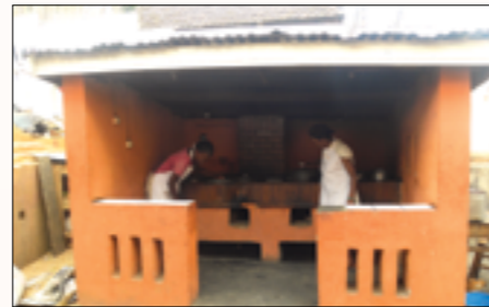
le nouveau réfrigérateur et la nouvelle cuisine extérieur