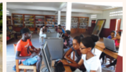
quelques élèves initiant l'informatique

■ partenaire ■ budget ■ numéro de la convention