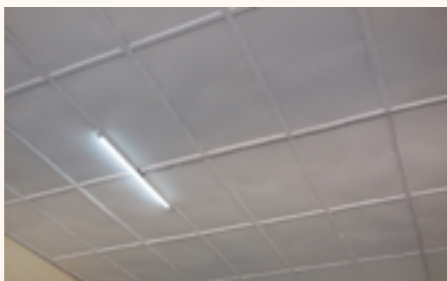
une salle de classe équipée de lampe LED

Afin d'améliorer les conditions d'apprentissage et dans l'objectif d'en faire une école pilote dans cette optique, le Consulat appuie depuis 2011 cette Ecole Primaire Publique qui existe depuis une soixantaine d'années et scolarisant 110 élèves.