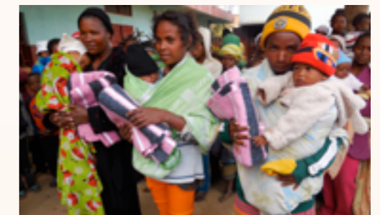
les enfants bénéficiaires des différents quartiers