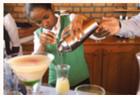
Les élèves de la Rizière en formation professionnelle

La coopération monégasque apporte un soutien à son initiative pour lui permettre de devenir rentable et d'atteindre l'autofinancement.