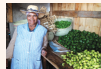
Bénéficiaire du volet micro-crédit

Depuis le début du projet, 30 familles ont bénéficié de microcrédit et d'accompagnement technique pour la construction d'un poulailler sécurisant leur cheptel. En parallèle, au niveau communautaire, 9 pépiniéristes ont été recrutés et formés au sein de la commune d'intervention. Des pépinières ont et près de 10 000 plants plantés sur les 28 000 prévus par le projet.