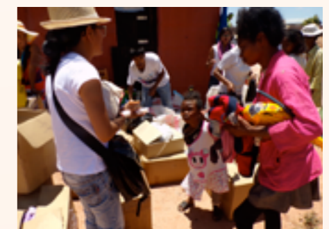
lors de la distribution des vêtements aux enfants

Dans le cadre de ses actions sociales, l'association a reçu en 2016 12 cartons de vêtements ainsi qu'un lot de chaussures à distribuer au profit des enfants du quartier de Namontana à l'occasion des fêtes de Noël.