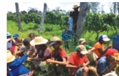
Sortie extrascolaire à Ambalavao des élèves de Ephata, école fianaraise soutenue dans le cadre du projet