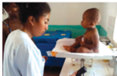
Séance de consultation dans un CSB de l'île de Sainte-Marie appuyé par le projet