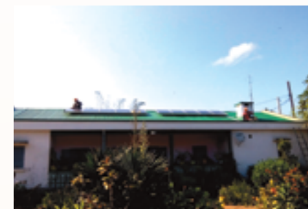
Installation de panneau solaire à l'orphelinat Fanantenana de Manajary

En 2016, 4 associations ont bénéficié des interventions d'EAM qui ont consisté principalement en de la réhabilitation et de la mise au norme électrique ainsi qu'en équipement en panneaux voltaïques.