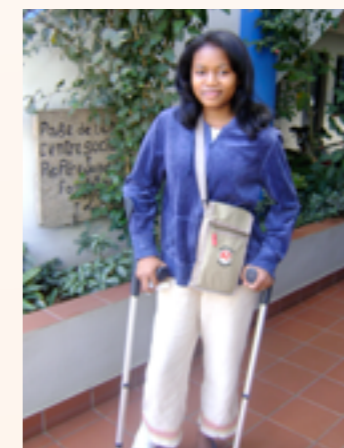
cannes de marche en utilisation

En 2016, il leur a été remis entre autres : des fauteuils roulants, cannes anglaises, cannes de marche, chaises plastiques, chaises pour bébé, chaises roulantes, potences, bocaux, consommables médicaux, compléments alimentaires, lits de voyage pour bébé, jouets et livres, seaux, 1 chariot, 1 déambulateur, 1 machine à café, vêtements enfants, linge de maison.