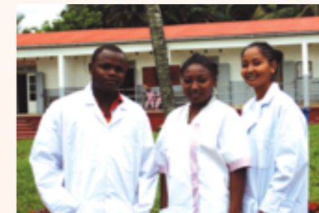
quelques médecins de l'hôpital avec les nouvelles blouses

Des blouses de médecin, sets de pose, sets de soin et divers consommables