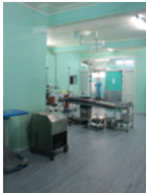
Bloc opératoire de chirurgie cardiaque inauguré le 16 décembre 2016 par Son Excellence M. Le Président de la République de Madagascar.