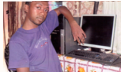
un des ordinateurs reçus

Il lui a été remis en 2016 des matériels et équipements de sport, des matériels scolaires, des ordinateurs et imprimantes ainsi que des consommables pour dispensaires.