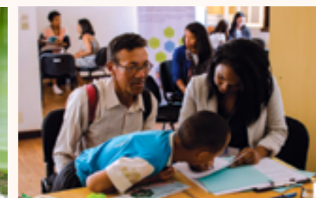
pendant la campagne de diagnostics