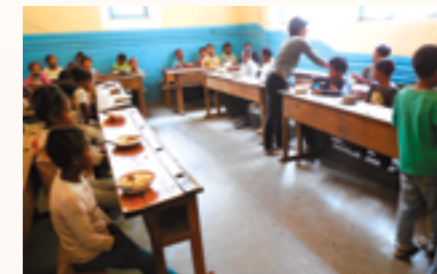
au moment des repas à la cantine