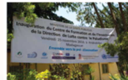
Inauguration de la salle de formation du centre national de lutte contre le paludisme

Le 25 novembre 2016, dans le cadre d'un partenariat tripartite Ministère de la santé - Organisation Mondiale de la Santé (OMS) - Principauté de Monaco, une nouvelle salle de conférence a été inaugurée en présence de Son Excellence Pr. ANDRIAMANANARIVO Mamy Lalatiana, Ministre de la Santé Publique du Gouvernement de Madagascar et Son Excellence M. Serges TELLE, Ministre d'Etat du Gouvernement Princier