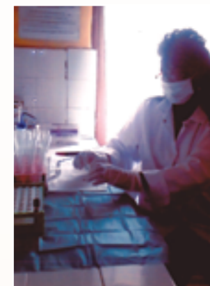
consommables en utilisation

Des blouses de médecin, chaises trouées, brassards et poires tensiomètre, pansements, tubes à essai, sets de soin et des bocaux en verre