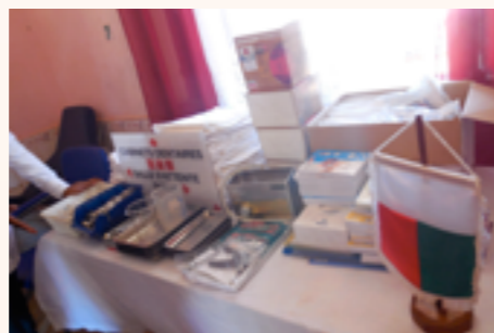
les outils pour cabinet dentaire, exposés lors de la signature de convention

1 fauteuil dentaire, des outils (petits matériels) pour cabinet dentaire, Potences, 1 chaise trouée, des blouses de médecin, gants et consommables