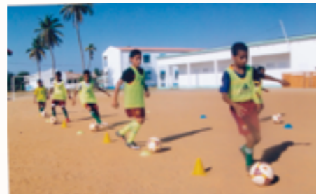
prêt pour l'éducation physique avec les nouveaux équipements

Des matériels de sport, des fournitures scolaires et des vêtements pour enfants leur ont été octroyés.