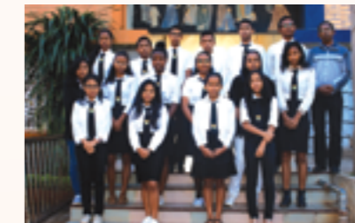
les élèves bénéficiaires de l'ESCA avec le Frère Directeur