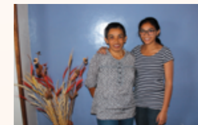
2 étudiants de la 1ère et 2ème promotion