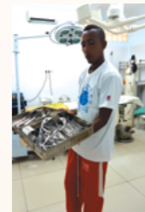
les pinces servis dans la salle de bloc opératoire

1 Matelas d'immobilisation, des blouses de médecin, lames pour laryngoscope, seringues de gavage, cathéters, gels nettoyant pour matériels médicaux, gants, sondes vésicales, seringues, micro perfuseurs, pinces Kocher