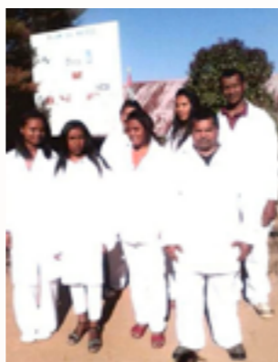
les médecins et infirmiers dans les blouses neuves

Des bocaux en verre pour laboratoire, lampes infrarouge, blouses de médecin, cathéters veineux, trousse pour césarienne, champs, seringues, et autres consommables médicaux