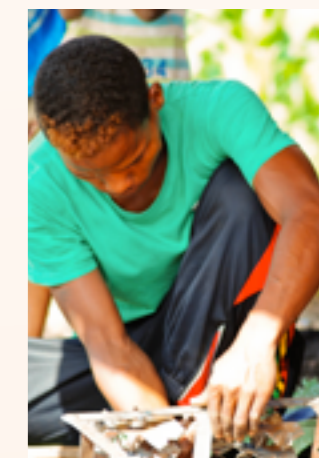
Bénéficiaire du volet micro-crédit