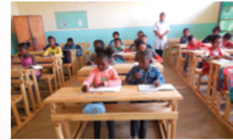
Des tables bancs neufs pour une meilleure éducation