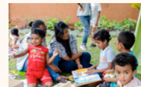
Quelques enfants autistes accompagnés par des bénévoles

Le concours financier du Consulat a été octroyé dans le cadre du projet de diagnostic gratuit mené par l'association ayant un double objectif : d'une part, de mener des campagnes de diagnostic et de recensement des enfants, et d'autre part, de contribuer à la naissance de réseaux de compétence locale. Un pool de praticiens (psychologues, orthophonistes, neurologues) ont ainsi été formés et 50 enfants de 3 à 14 ans diagnostiqués.